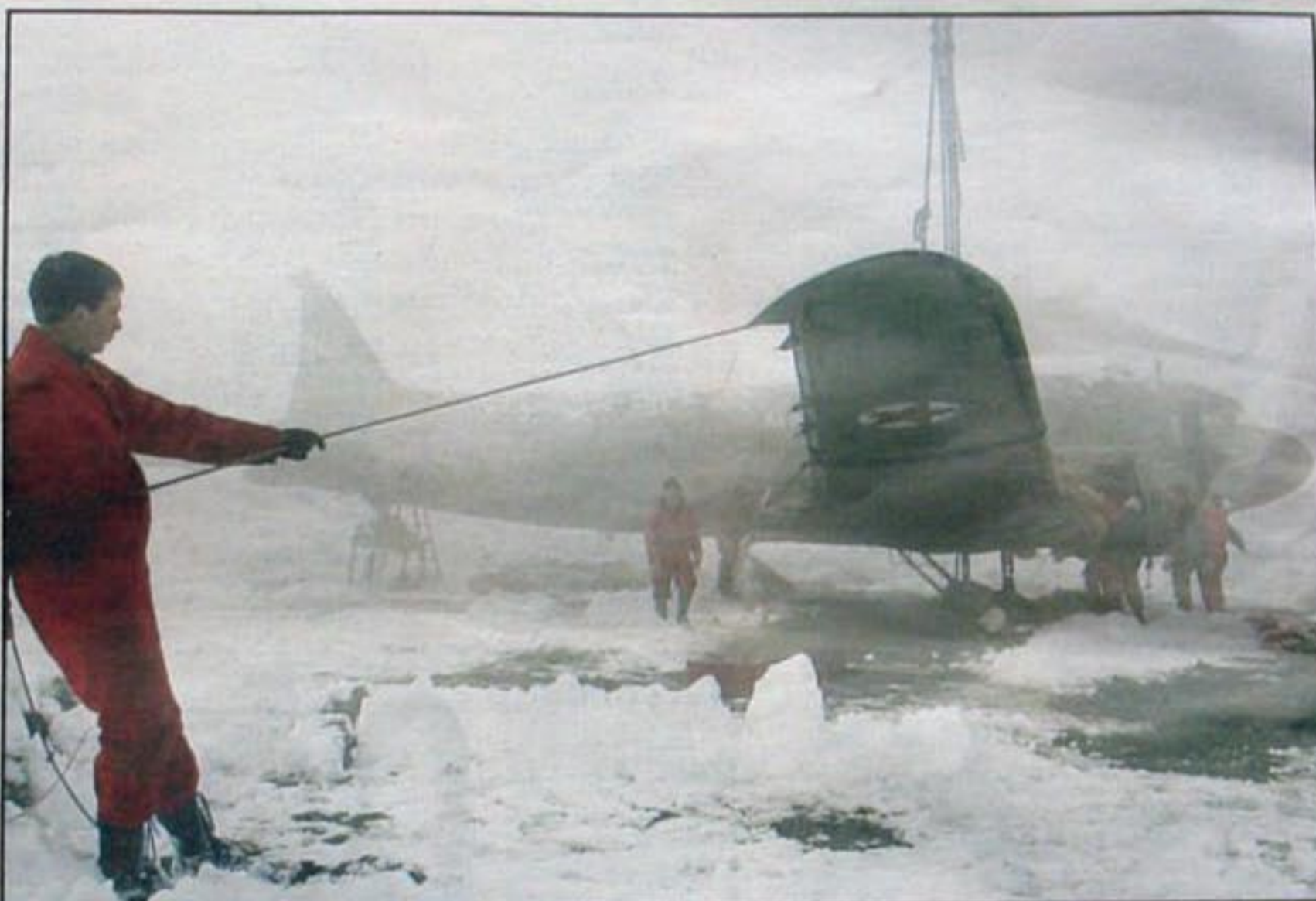
Uz pomoć EUFOR-a, snijeg nije zaustavio entuzijaste